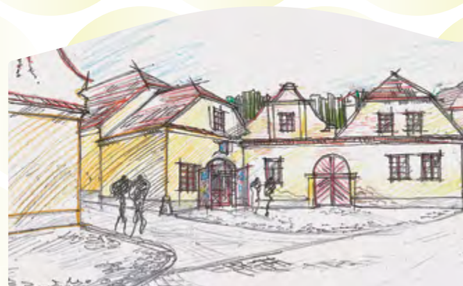
Mikroregionální komunitní centrum, perspektiva – Jiráskova ulice

Na konci února 2019 Sdružení měst a obcí Vltava podepsalo smlouvu se stavební společností Metrostav a.s. na vybudování mikroregionálního Komunitního centra sounáležitosti, které se bude nacházet v Týně nad Vltavou. Komunitní centrum bude místem pro vzdělávání, formální i neformální setkávání, kulturní vystoupení, sociální a volnočasové aktivity pro obyvatele mikroregionu Vltavotýnsko. Vznik tohoto víceúčelového zařízení je finančně podpořen z Evropské unie. O průběhu výstavby vás budeme i nadále informovat.