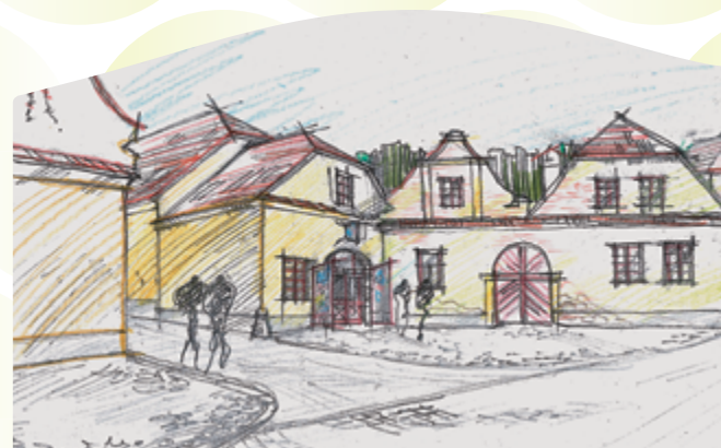
Mikroregionální komunitní centrum, perspektiva – Jiráskova ulice

Na konci února 2019 Sdružení měst a obcí Vltava podepsalo smlouvu se stavební společností Metrostav a.s. na vybudování mikroregionálního Komunitního centra sounáležitosti, které se bude nacházet v Týně nad Vltavou. Komunitní centrum bude místem pro vzdělávání, formální i neformální setkávání, kulturní vystoupení, sociální a volnočasové aktivity pro obyvatele mikroregionu Vltavotýnsko. Vznik tohoto víceúčelového zařízení je finančně podpořen z Evropské unie. O průběhu výstavby vás budeme i nadále informovat.